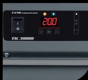
Termostato / Thermostat